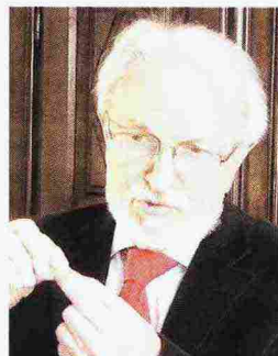
Elvio Fassone: magistrato di Cassazione, presidente di Corte di Assise, già membro del Csm e senatore per due mandati

ché è irreversibile. L'altro limite è l'attenzione al percorso, poi per reati particolarmente gravi, ripugnanti, questa attenzione può esigere un'espiazione non da poco. La pietas come sentimento può nascere subito. Il perdono legale ha delle cadenze che devono mediare tra l'attenzione alla persona del condannato e la sensibilità della comunità. È un bilanciamento fra valori contrapposti».