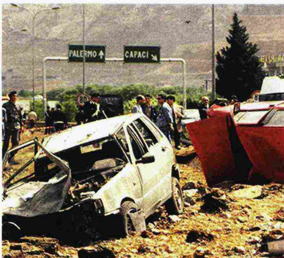
La strage di Capaci, nella quale morirono Falcone, la moglie e gli uomini della scorta. Si parla anche di questo, nel libro di Fassone

mana. Oggi c'è un'attenzione forte. Ci sono decine di migliaia di persone, i volontari, gli educatori, gli psicologi, che non fanno parte dell'istituzione che punisce, ma di quella società che cerca di medicare la pena, alzando un po' il livello di umanità e di solidarietà, anche in carcere».