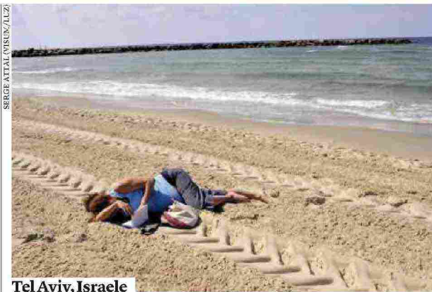
Tel Aviv, Israele

Fino a qualche anno fa i libri dei grandi scrittori israeliani come Amos Oz, Sayed Kashua o Etgar Keret dominavano le classifiche dei libri più venduti nel paese. Adesso può succedere ancora, ma è quasi una notizia. Nel 2019, i romanzi di David Grossman ed Eli Amir sono rispettivamente al primo e al sesto posto della classifica dei libri più venduti da Steimatzky, la principale catena di librerie israeliana, ma gli altri titoli non hanno la stessa rilevanza letteraria. Basta un'occhiata alla classifica fornita dalla seconda catena di librerie israeliana, Tzomet Sefarim, per avere alcune con-