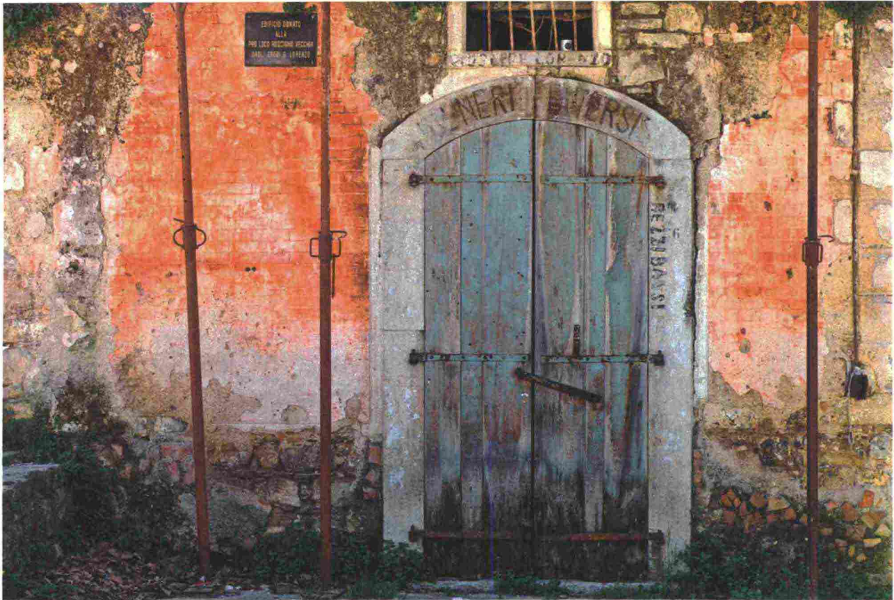
Il borgo disabitato di Roscigno, Cilento. In Italia, i paesi abbandonati sono circa 6 mila.

tantissime storie, e mi sono reso conto che il fenomeno non è limitato ai paesi di montagna».