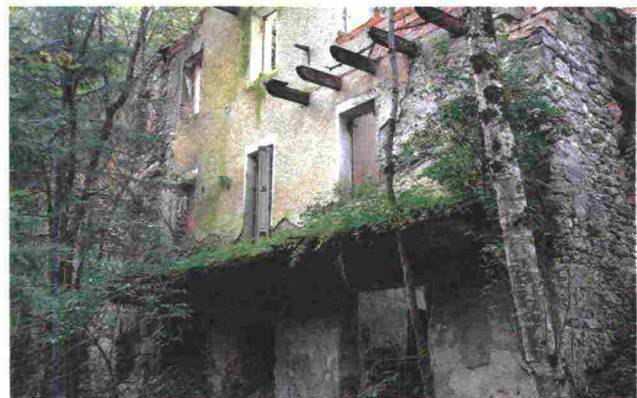
Una casa in rovina nel borgo bellunese di Gosaldo. Una delle sue frazioni prende il nome di California.

Poetico e incantato. Mario Ferraguti in Le voci delle case abbandonate (Ediciclo) esplora luoghi e ambienti dove le presenze del passato rivivono. E tornano a parlarci.