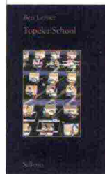
Topeka School, di Ben Lerner, Sellerio, 16 euro

Lo scrittore americano Ben Lerner, 41 anni