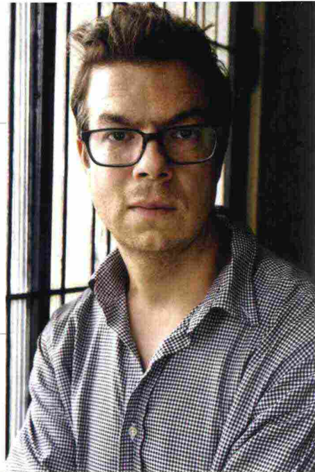
Ulf Andersen/Getty Images