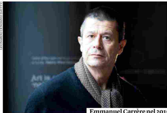
Emmanuel Carrère nel 2015