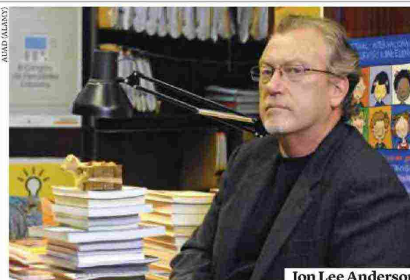
Jon Lee Anderson

Nel libro Los años de la espiral. Crónicas de América Latina pubblicato a ottobre dalla casa editrice Sexto Piso, il giornalista statunitense Jon Lee Anderson riunisce più di quaranta articoli, tra reportage e ritratti, scritti dal 2010 al 2020. Un mosaico della regione di cui Anderson ha seguito da vicino le vicende politiche. "In questo decennio la ciclicità della storia si è fatta sentire con particolare forza in America Latina", dice Anderson. "Abbiamo visto la sinistra arrivare al potere in Cile, Bolivia, Brasile e Argentina. Ma allo stesso tempo abbiamo assistito alla crisi del suo progetto politico e alla scomparsa di fi-