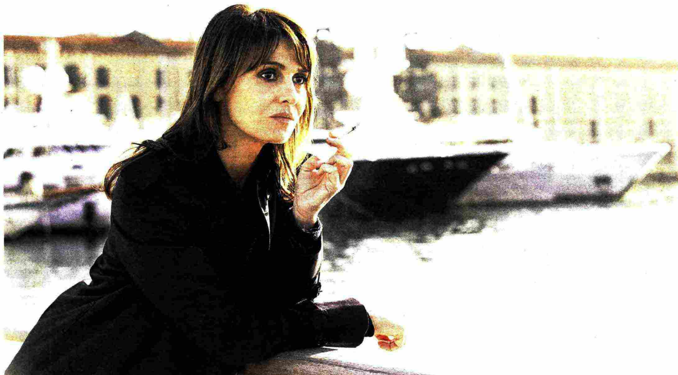
Paola Cortellesi veste i panni di Petra nella serie tv tratta dai gialli «barcellonesi» riambientati a Genova