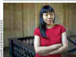
DAVID LEVENSÓN (GETTY)