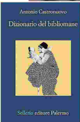
Un uomo prende un volume dal ripiano di una biblioteca. Accanto la copertina del libro "Dizionario del bibliomane" (Sellerio)