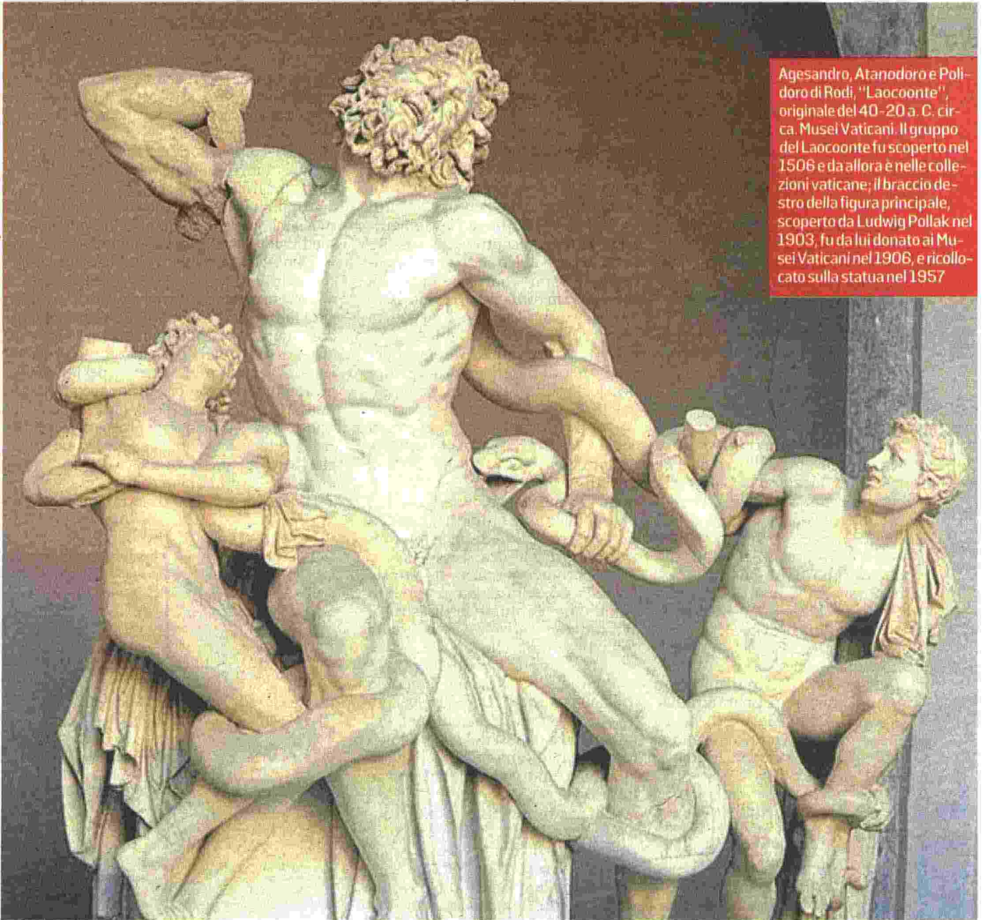
Agesandro, Atanodoro e Polidoro di Rodi, "Laocoonte", originale del 40-20 a. C. circa. Musei Vaticani. Il gruppo del Laocoonte fu scoperto nel 1506 e da allora è nelle collezioni vaticane; il braccio destro della figura principale, scoperto da Ludwig Pollak nel 1903, fu da lui donato ai Musei Vaticani nel 1906, e ricollocato sulla statua nel 1957