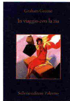
In viaggio con la zia di Graham Greene SELLERIO, PAGG. 432, EURO 18

Un'avventura intrisa di ironia e di situazioni paradossali che raccoglie i temi classici di Greene: la famiglia, la religione, lo spionaggio, l'impostura, il gusto per i luoghi esotici e per la provincia inglese. Si parla di vecchiazza e di morte, ma l'effetto è molto più l'entusiasmo di narrare e di vivere che l'ombra. Ecco allora Pulling, un cinquantenne direttore di banca in pensione anticipata, che incontra al funerale della madre la zia Augusta, folgorante settantacinquenne che trascina il nipote nel ciclone della sua vita in continuo movimento. Tra relazioni sentimentali senza limite di tempo e geografie, è la cavalcata di parole più lontana che si possa immaginare dalla noia. G.C.