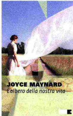
L'albero della nostra vita di Joyce Maynard NNE, PAGG. 494, EURO 20