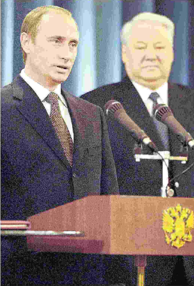
Vladimir Putin nel 2000 con alle spalle Boris Eltsin