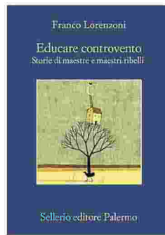
La copertina dell'ultimo libro di Franco Lorenzoni, il maestro che fa dell'insegnamento un laboratorio di vita.