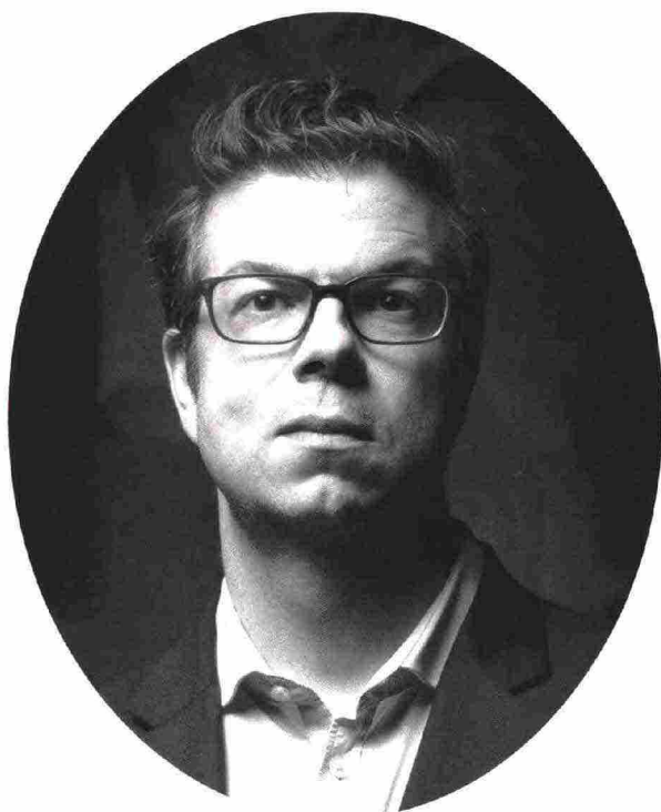
Ben Lerner È nato nel 1979 a Topeka , in Kansas. Poeta e romanziere, è una figura centrale della letteratura americana di questi ultimi anni.