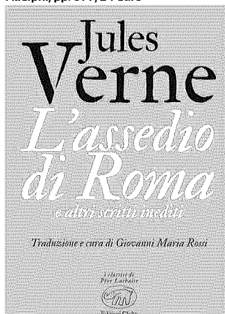
L'assedio di Roma e altri scritti inediti Jules Verne Clichy, pp. 472, 25 euro