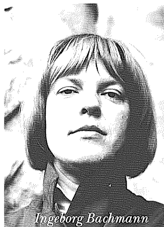
Il libro Franza Ingeborg Bachmann Adelphi, pp. 377, 14 euro