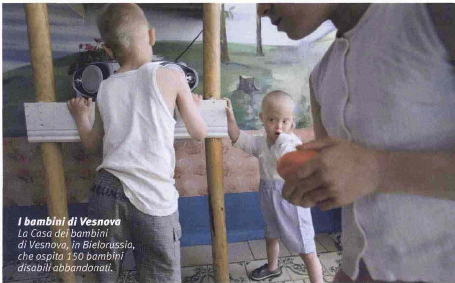
I bambini di Vesnova La Casa dei bambini di Vesnova, in Bielorussia, che ospita 150 bambini disabili abbandonati.