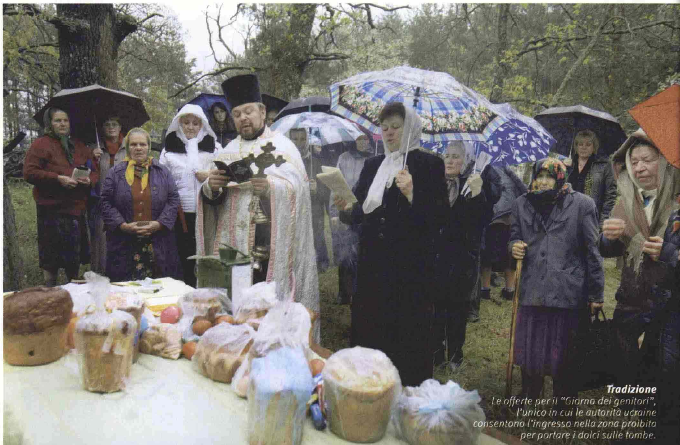
Tradizione Le offerte per il "Giorno dei genitori", l'unico in cui le autorità ucraine consentono l'ingresso nella zona proibita per portare i dolci sulle tombe.