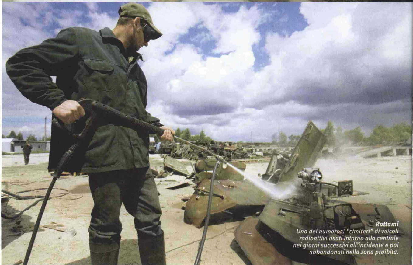
Rottami Uno dei numerosi "cimiteri" di veicoli radioattivi usati intorno alla centrale nei giorni successivi all'incidente e poi abbandonati nella zona proibita.