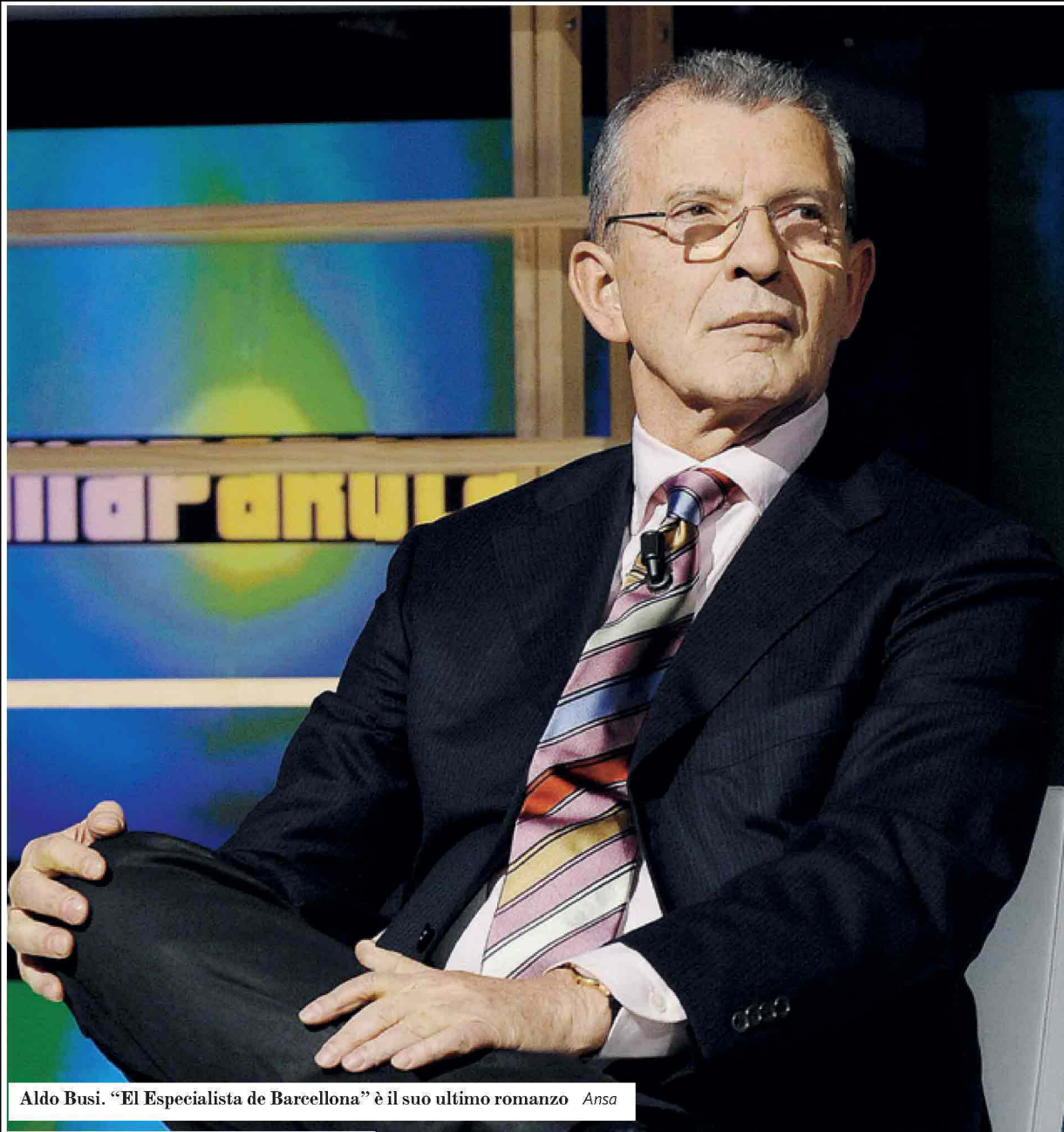
Aldo Busi. "El Especialista de Barcelona" è il suo ultimo romanzo