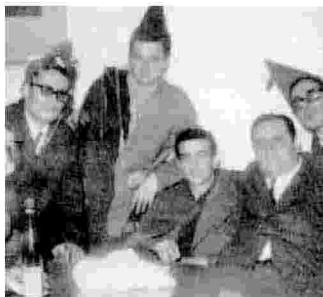
Festa della matricola

Aspettai sei ore per l'esame di Economia politica. Mirabella discuteva della sua presidenza dell'Irfis.