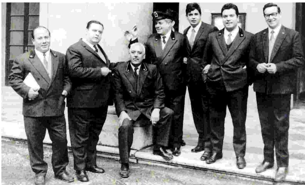
FOTORICORDO I custodi della sede centrale dell'Università in un'immagine degli anni Sessanta (foto di Guido Curzi premiata nel 2007 al concorso "Fotostoria dell'Ateneo") In basso il prospetto della facoltà di Giurisprudenza in via Maqueda