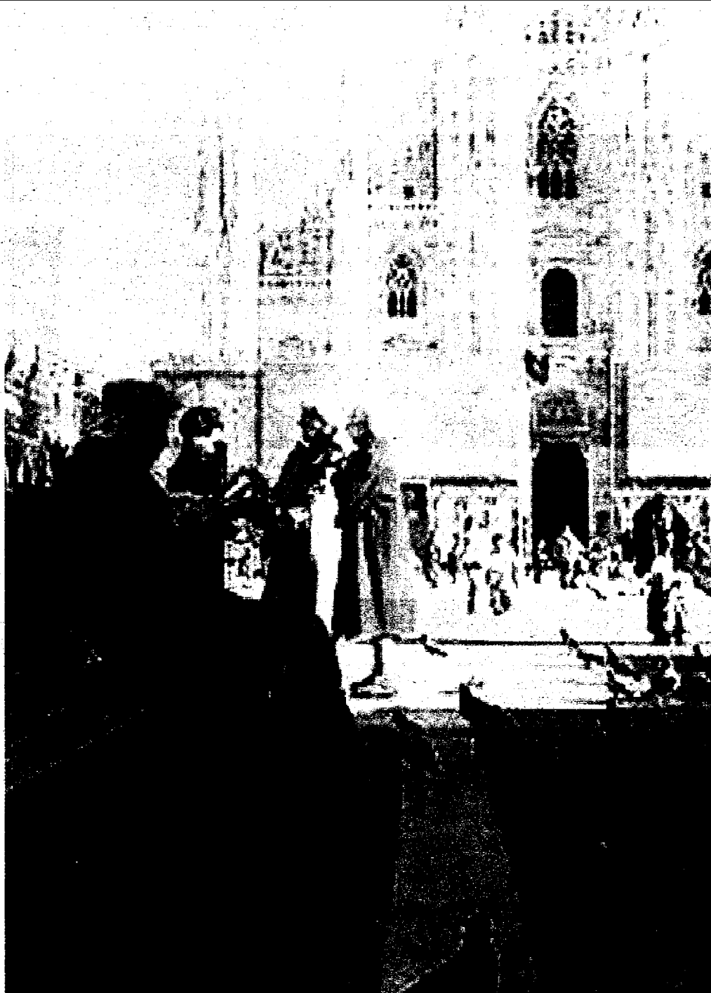
Tante Milano, una accanto all'altra. La città è una vera protagonista del romanzo

■ ■ Possibile che nello stesso luogo vivano senza vedersi persone, popoli, cose così diverse? Sì