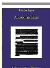
La cover del libro «Autocurriculum»

«La parola è l'arma dell'Europa, è la risposta che la vecchia Europa,