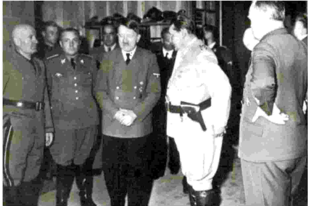
Mussolini con Hitler il 20 luglio 1944: il Duce arrivò in visita subito dopo l'attentato