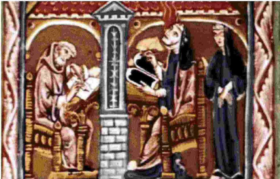
Una miniatura in cui è rappresentata Ildegarda. Molto venerata, la badessa tedesca, si occupò delle cure