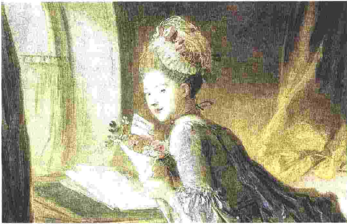
LA LETTERA D'AMORE Un'opera settecentesca con una dama intenta a scrivere una missiva al suo spasimante.