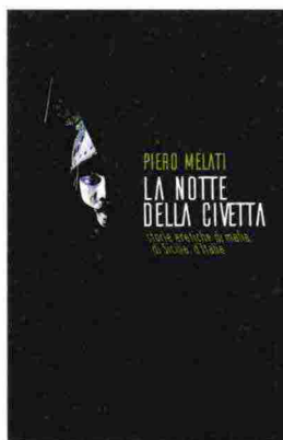
La notte della civetta Piero Melati Zolfo Editore Pag. 283 - 18 Euro

Chi di noi, oggi, può dire: non sapevamo?