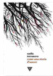
Nadia Terranova Come una storia d'amore Perrone

È insieme un atto di amore e di scoperta quello che la scrittrice messinese dedica a Roma con questo libro. Una Roma grande, immensa, da svelare ma pure difficile da vivere, talvolta soffocante, spesso indifferente. In questo immenso palcoscenico della città eterna si muovono i personaggi dei "quadri" dipinti dalla Terranova, colti, per lo più, mentre sono sulla soglia di un cambiamento, magari congelati in un ricordo. Aspettano di essere liberi e scoprono, a volte, che per riuscire a raggiungere la felicità è necessario perdersi. Cosa peraltro facilissima in una città come Roma, fra le sue vie e i suoi quartieri.