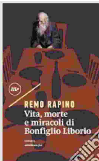
Remo Rapino Vita, morte e miracoli di Bonfiglio Liborio MINIMUM FAX

Lo sguardo si sposta sugli Usa, con «Il decoro» di David Leavitt, Sem, per indagare sulle ansie e lo smarrimento dell'alta borghesia liberal di New York all'arrivo di Donald Trump alla Casa Bianca (novembre 2016) Da un'elegante villa del Connecticut agli appartamenti nell'Upper East Side di Manhattan, Leavitt racconta le preoccupazioni d'una ricca signora, Eva Lindquist e degli amici (editoria, finanza, giornalismo, moda), sino alla suggestione d'una fuga verso un mondo più sicuro, comprando un antico palazzo di Venezia. Ci sono preoccupazioni politiche, sulle forti inclinazioni di destra, razziste e sessiste di Trump. E questioni di stile, per la pacchianeria delle scelte formali. Si discute di cultura e arredamento, libri e cibo, politica e pettegolezzi. E Leavitt usa con sicurezza lo sguardo acuto dell'indagine personale e sociale e una sofisticata ironia per rivelare, di quella borghesia democrat, la vacuità formale di scelte e comportamenti. Che nesso c'è tra eleganza e libertà?