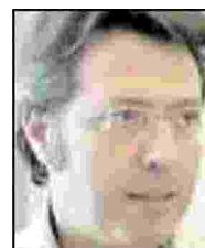
Angelo Carotenuto, Le canaglie, Sellerio, 364 p, 16 euro