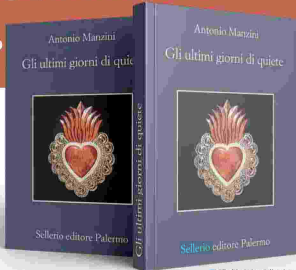
■ Gli ultimi giorni di quiete (Sellerio)

Con la televisione. Pensi, Canale Cinque il pomeriggio è guardato da 4 milioni di persone. Un libro, quando è un successo, arriva a 500mila copie.