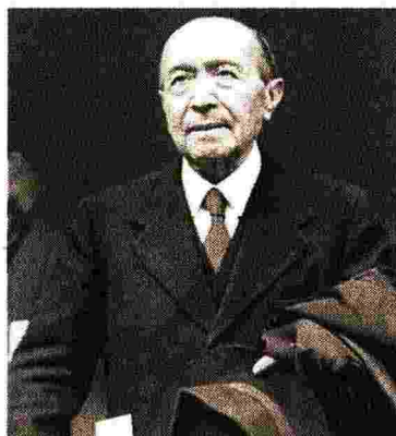
Concetto Marchesi (1878-1957) fu deputato del Pci del 1946 al 1957

● Canfora ha dedicato a Marchesi la biografia Il sovversivo (Laterza, 2019)