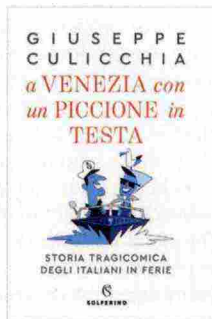
A Venezia con un piccione in testa di Giuseppe Culicchia SOLFERINO, Pagg. 187, EURO 16

«La vita vale la pena di esser vissuta solo per mostrare ad altri viventi di essere adatti in vacanza, o a mangiare fuori, o a visitare quel dato museo o monumento o paesaggio urbano... L'obiettivo è scattare un selfie della location...». Dalla penna ironica di Giuseppe Culicchia usi e costumi degli italiani in ferie, con o senza mascherina. Così nella Londra della Brexit e del tramonto dell'Impero britannico l'italiano non può fare a meno di infastidire i granatieri reali, a Berlino trova sempre qualcuno che gli dice che era meglio andarci prima della caduta del Muro e a Ibiza annega nel Moscow mule. Tra esodi e controesodi si scorre anche l'Italia da Nord a Sud. E si ride. Un po' amaro. M.G.L.