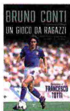
BRUNO CONTI UN GIOCO DA RAGAZZI (Rizzoli)

L'autobiografia di un simbolo del calcio, dai campetti della periferia al trionfo del Mondiale