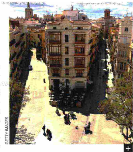
Il centro di Valencia , dove è ambientato il libro La presidente . In basso, le scrittrici noir P.D. James e Ruth Rendell

è morta avvelenata) perché essendo inesperte, saranno incapaci e più manovrabili (questa l'idea dei superiori). Un'illusione naturalmente, perché Berta e Marta non si perderanno e risolveranno il caso mentre dall'alto volevano solo chiuderlo in fretta con un decesso per cause naturali (infarto).