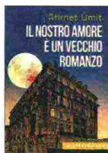
AHMET ÜMIT IL NOSTRO AMORE È UN VECCHIO ROMANZO (Scritturapura)

Tre omicidi a Istanbul nei racconti di uno dei più noti giallisti turchi.