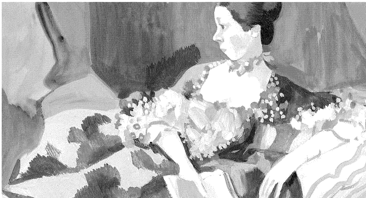
ILLUSTRAZIONE DI MANUELE FIOR

“La donna nel XVIII secolo” di Edmond e Jules de Goncourt (Sellerio, a cura di Francesca Sgorbati Bosi) raccoglie documenti e testimonianze del '700. La foto di Baricco è © LesAmp&rsands