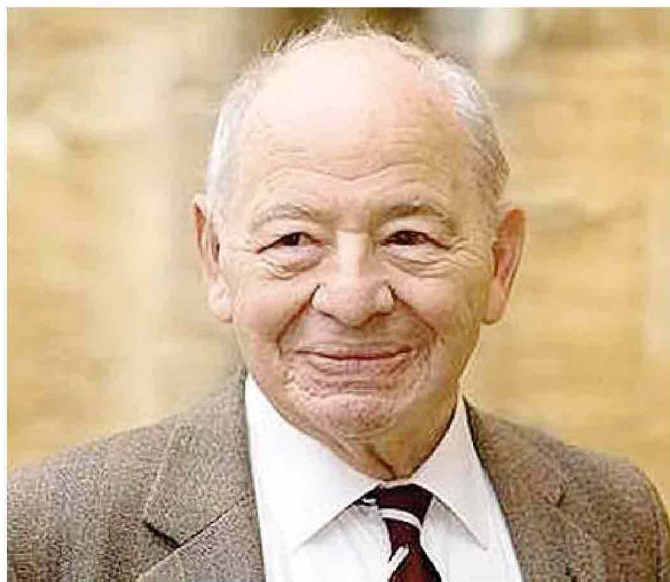
Colin Dexter, classe 1930, è un scrittore britannico

Il protagonista, uomo di legge soggetto a improvvisi e spesso immotivati accessi d'ira, vit-