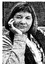
Alicia Giménez Bartlett ha 61 anni

è fatta da «i deliri di Fellini, la grandiosità circense della Roma imperiale hollywoodiana, le lezioni sull'arte del Rinascimento, il neorealismo di Vittorio De Sica, l'immagine infallibile di Audrey Hepburn e Gregory Peck allacciati in sella a una Vespa».