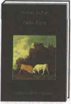
ORLEY FARM di Anthony Trollope (Sellerio)