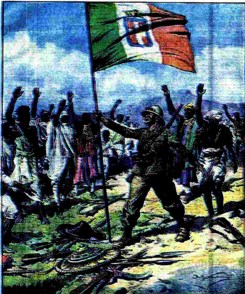
Tutti i territori dell'Impero sono occupati. Le popolazioni, sottomesse, salutano il Tricolore.

Il retorico e vuoto trionfalismo e la realtà cupa degli orrori in un vero noir